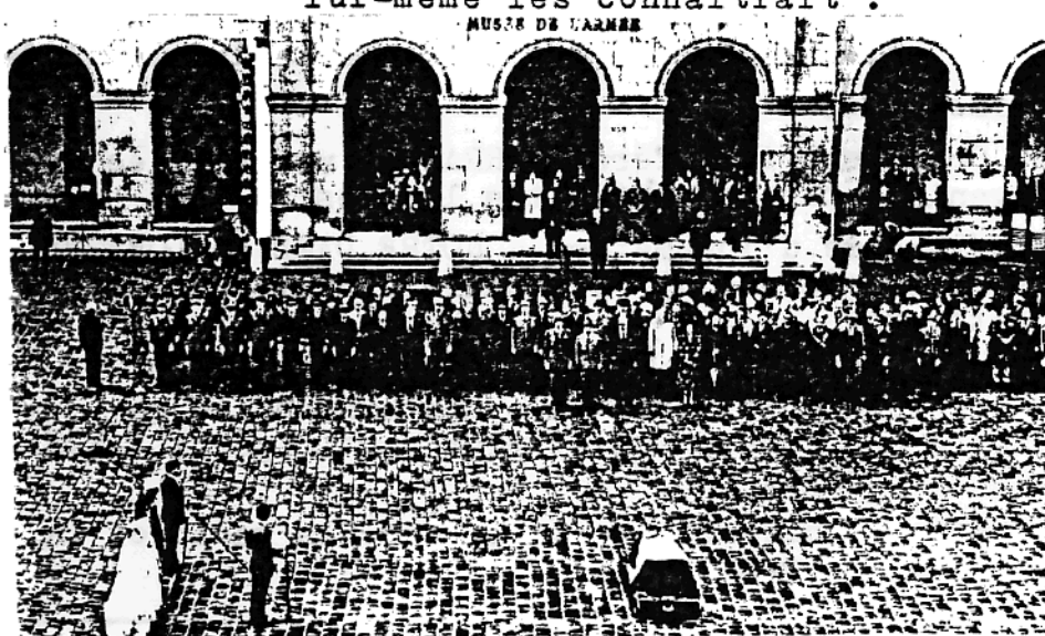
- Absoute -