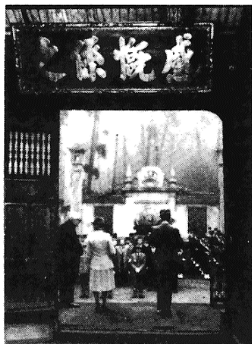
La cérémonie au Temple du Souvenir

" L'France n'a pas voulu qu'il en fût ainsi... Là... se dresse le Temple qu'elle a édifié avec vous aux soldats Indochinois morts pour elle... C'est la pieuse demeure de vos morts... Je me rappelle mon émotion profonde et celle des assistants, lorsque... l'Envoyé extraordinaire de l'Annam gravit lentement les degrés du temple pour l'ouvrir aux âmes des héros. Alors surgit... l'image du peuple vaillant et digne que la France tient plus que jamais à diriger dans la voie du progrès et du bonheur."